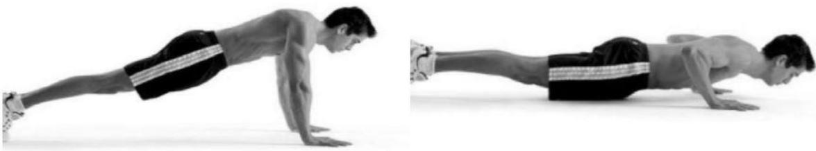
نحوه اجرای شنای سوئدی (ویژه آقایان)

نحوه اجرا: ابتدا باید حالت حرکت پلانک را در بدن خود ایجاد کنید، دست ها را محکم بر روی زمین و دقیقاً زیر شانه ها قرار دهید. پنجه و نوک انگشتان پا را بر روی زمین عمود کنید تا در حرکات عضلات پایین تنه تعادل خوبی ایجاد شود. در این حالت (پلانک)، عضلات شکم خود را منقبض کرده، عضلات همسترینگ پاها و ماهیچه های باسن را درگیر کنید، و کمر خود را صاف نگه دارید تا تمام طول بدن مستقیم و کشیده به نظر برسد. در چنین حالتی با به کار انداختن کرنومتر شروع به پایین آوردن بدن خود می کنید. حین پایین آمدن، کمر را صاف نگه داشته و انحنای طبیعی گردن را حفظ کنید، و بهتر است بیش از حد سر خود را بالا نیاورید، نگاه خود را کمی به سمت جلو خیره کنید. به باسن یا پایین کمر خود اجازه خم شدن ندهید، بدن از سر تا نوک انگشتان پا باید در یک خط مستقیم قرار بگیرد. تیغه های شانه خود را به سمت پایین ببرید، و دقت کنید که ارنج ها کنار بدن قرار بگیرند. سپس بدن را بالا بکشید و به همان حالت اول برگردید. این حرکت را پشت سر هم تا ۳۰ ثانیه ادامه دهید. ملاک امتیاز دهی، تعداد صحیح حرکت شنای سوئدی می باشد.